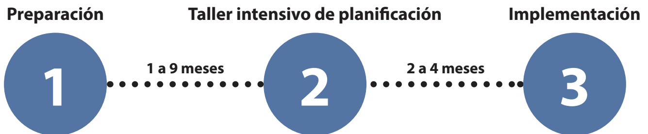
Figura 1. Marco de tres fases del taller intensivo de planificación (s.d. de NCI)